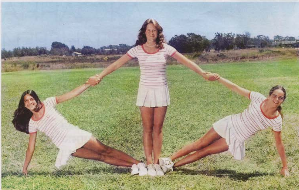
Зато окончила престижную Beverly Hills High School, занималась плаванием, была в команде чирлидеров (я в центре)