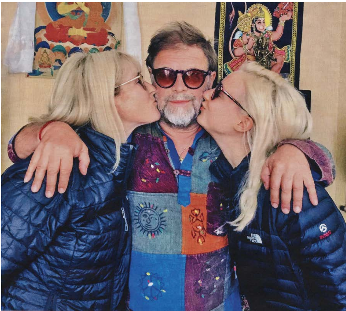
Борис все такой же, он хочет делать только две вещи: писать песни и выступать. В чем-то мои русские друзья не изменились. С Гребенщиковым и Мэдисон