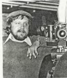
Sergei Aleksandrovitsj Solovjov