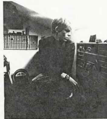
Sergej Bugaev alias Afrika alias Bananan de hoofdrolspeler in "ASSA"

Met een flinke stunt dacht Solovjov de première op te luisteren: een ART-ROCK-PARADE, met pop, mode en schilderijen en plakaten. Om duistere rekens om de show niet door en bleef de film over. Of